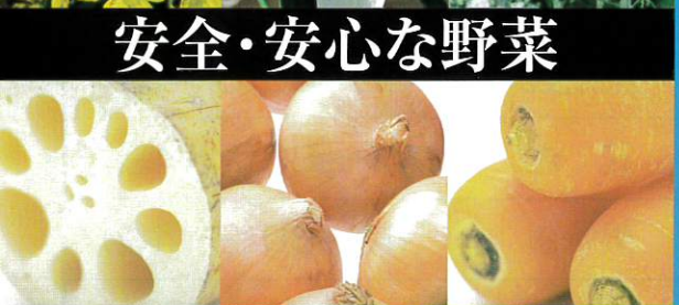
安全・安心な野菜